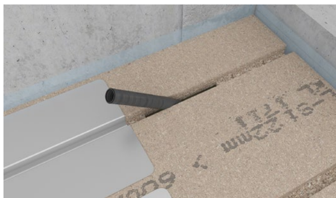
Figur 5 Klimagulvpladen monteres og tomrøret trækkes op gennem gulvpladen.