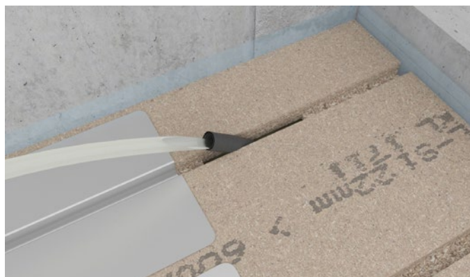
Figur 9 Varmetrøret føres gennem tomrøret og lægges i sporene på Klimagulvet.