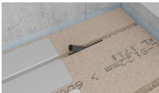
Figur 7 Kontrollér at tomrørets ende er i niveau med gulvpladen.