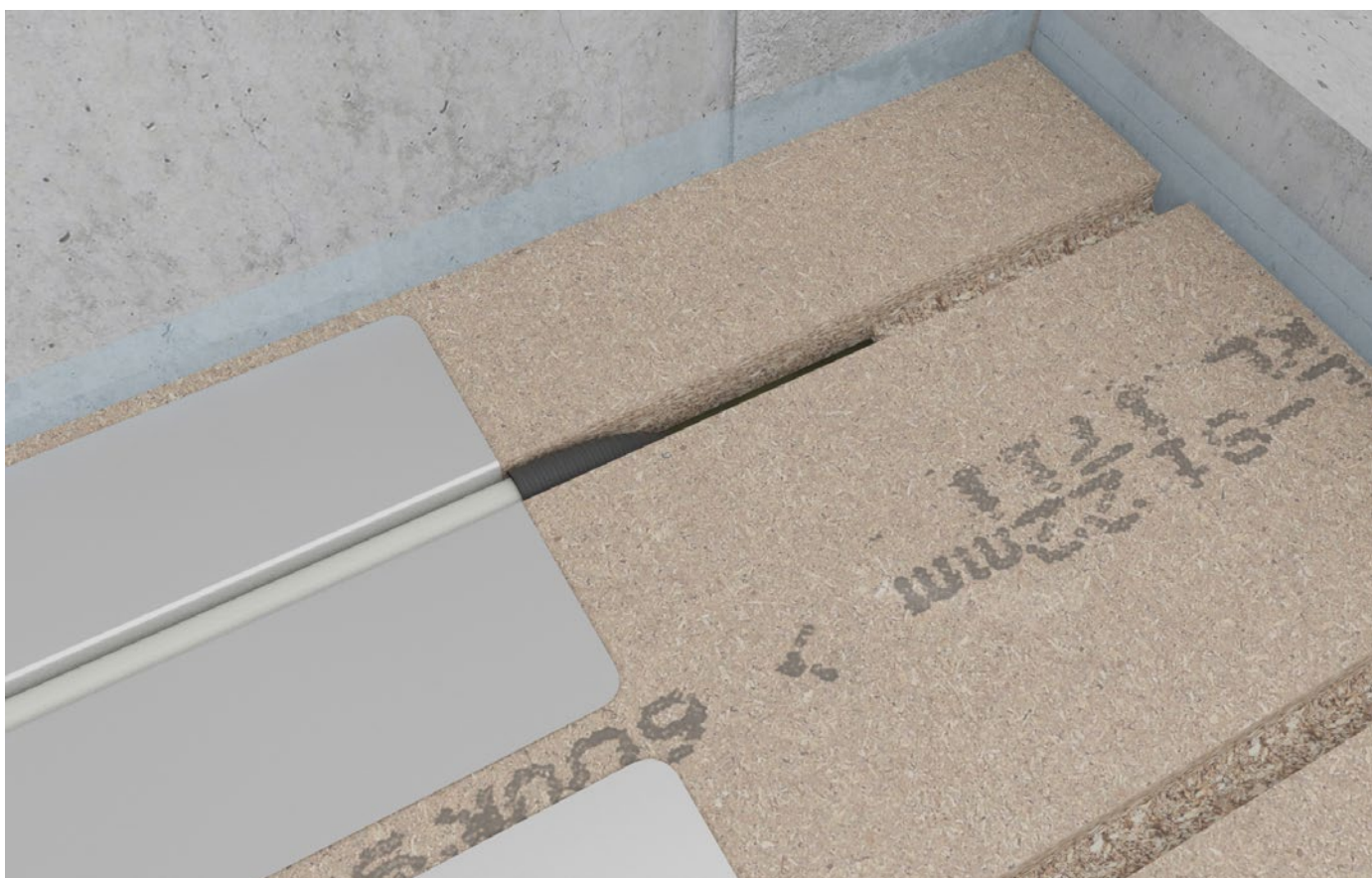
Figur 1 Novopan Klimagulv med tomrørsinstallation.

Se også monteringsanvisningerne for Novopan Klimagulve.