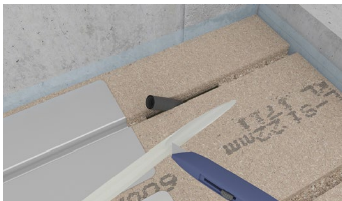
Figur 8 Varmetrøret kan med fordel spidnes med en kniv for at lette gennemføringen i tomrøret.