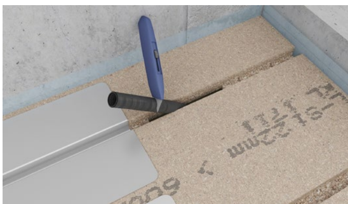
Figur 6 Den overskydende del af tomrøret skæres af.