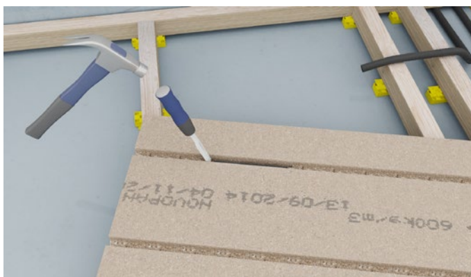
Figur 4 Hullet hugges rent med et stemmejern.