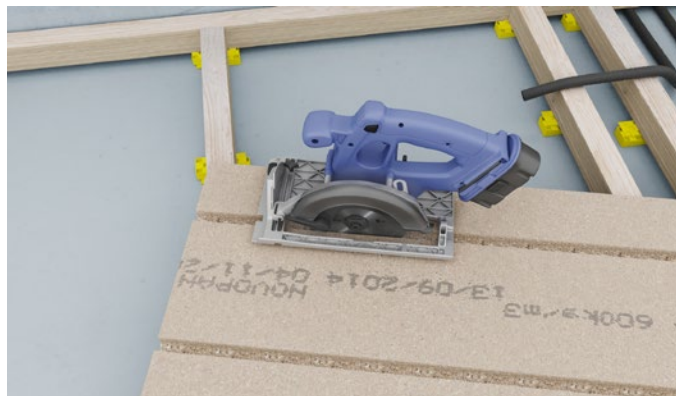
Figur 3 Der skæres et hul på 15-20 cm i bunden af sporet på Klimagulvet på det sted, hvor tomrøret skal komme op gennem gulvpladen.